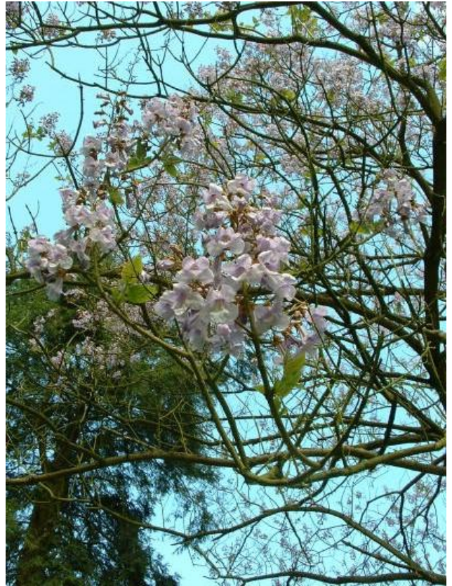
FOTO: detail van de bloemtrossen