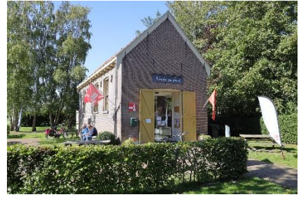
V.l.n.r. De brandweerkazerne, de lagere school en het slachthuis