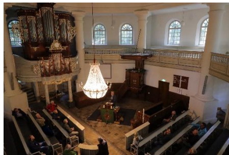
De koepelkerk van buiten en van binnen.